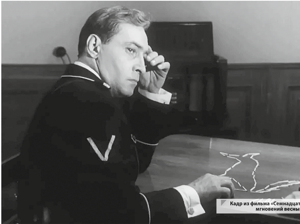
Кадр из фильма «Семнадцать мгновений весны»

Леман также сообщил, что фирма «Вальтер» приступила к массовому выпуску своего знаменитого детища — модели пистолета П-38, и еще немало ценных сведений о тайных шагах Германии по созданию мощного подводного флота и о ракетной отрасли, которую возглавил молодой ученый Вернер фон Браун, будущий создатель «Фау-1» и «Фау-2». Брайтенбах рассказал, что в закрытых лабораториях идут работы над созданием боевых отравляющих веществ нового поколения, что авиаинженер Мессершмитт разрабатывает